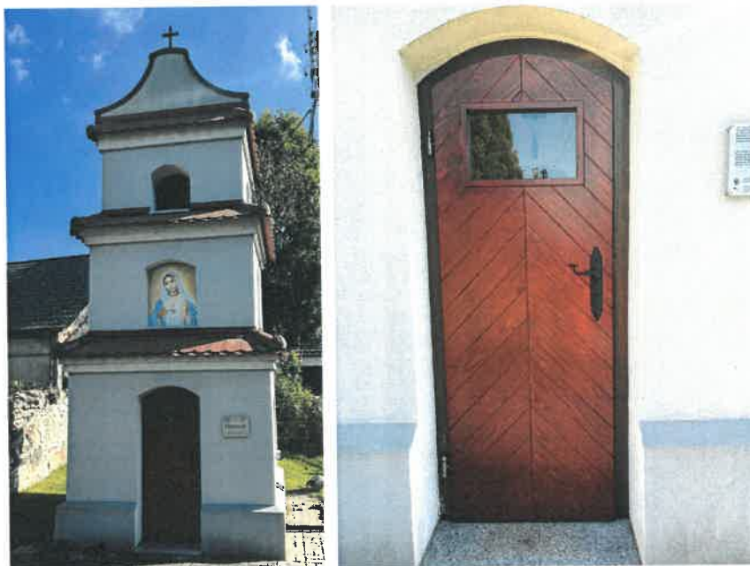
Źródło: zdjęcia własne. Kapliczka dzwonnica w Dąbrowicach.