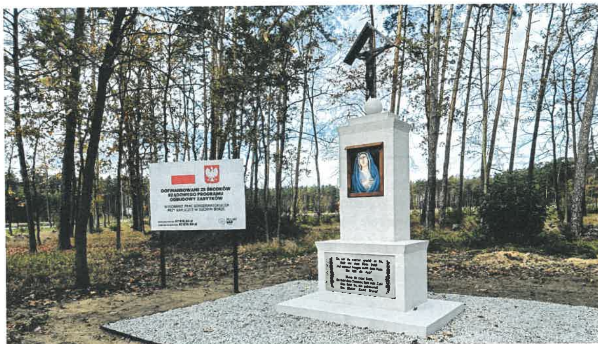
Kapliczka w Suchym Borze w Suchym Borze.

Zakres prac obejmował m.in.: wypionowanie kapliczki, usunięcie nawarstwień malarskich poprzez wstępne oczyszczenie wodą pod ciśnieniem lub parą wodną, mechaniczne doczyszczenie miejsc bardziej zanieczyszczonych, doczyszczenie ręczne miejsc pokrytych glonami i mchem, odpylenie, wypełnienie rys i spękań, malowanie powierzchni kapliczki, zabezpieczenie całej powierzchni środkiem do hydrofobizacji, oczyszczenie marmurowej płyty inskrypcyjnej, uczytlnienie napisu i rysunku ornamentu farbą do renowacji liter, impregnację płyty, wykonanie kopii obrazu Matki Boskiej i umieszczenie go w przeszklonej niszy górnego postumentu. Zadanie zostało sfinansowane ze środków własnych firmy ELM Design Sp. z o.o. Sp.K. w wysokości 959,40 zł tj. 2%, oraz środków z Rządowego Programu Odbudowy Zabytków w wysokości 47.010,60 zł tj. 98%. Łączny koszt realizacji zadania wyniósł 47.970,00 zł.