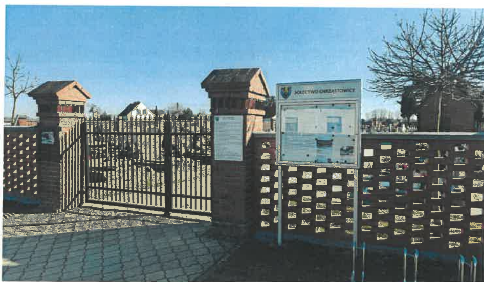
Ogrodzenie cmentarne w Chrzastowicach.