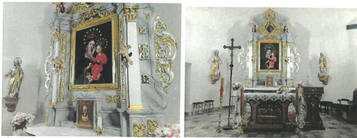
Ołtarz kościoła parafialnego w Lędzinach.

Zakres robót obejmował m.in.: oczyszczenie powierzchni obiektu z zabrudzeń, dezynfekcję, wykonanie odkrywek w celu ustalenia pierwotnej kolorystyki ołtarza, usunięcie przemalowań i wtórnych złoteń, wzmocnienie elementów drewnianych, rekonstrukcję brakujących elementów snycerki, uzupełnienie ubytków, scalenie kolorystyczne, wykonanie złoteń na poler i mat złotem i srebrem płatkowym, pokrycie obiektu werniksem, oczyszczenie obrazów wraz z montażem poszczególnych elementów ołtarza. Zadanie zostało sfinansowane ze środków własnych Parafii w wysokości 3.700,00 zł tj. 2 %, środków z Rządowego Programu Odbudowy Zabytków w wysokości 181.300,00 zł tj. 98 %. Łączny koszt realizacji zadania: 185.000,00 zł.