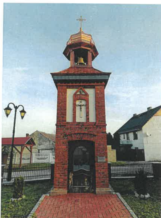
Kaplica dzwonnica w Dańcu.

Dodatkowo w 2025 r. zostały wymienione okna i drzwi w kaplicy dzwonnicy w Dańcu przy ul. Dąbrowickiej (pomiędzy budynkami 2A i 4) na kwotę 6.236,10 zł ze środków własnych gminy.