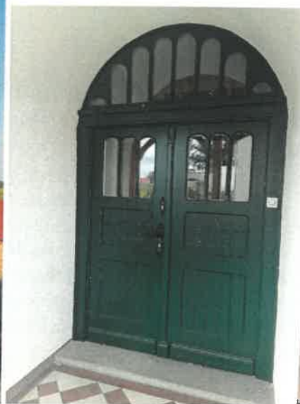
Plebania kościoła Parafialnego pw. Niepokalanego Poczęcia NMP w Chrzastowicach.