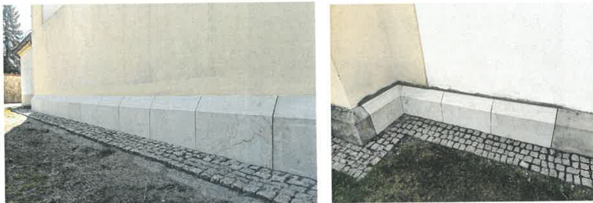
Elewacja kościoła parafialnego pw. Narodzenia NMP w Dębciu.

Zakres prac obejmował m.in.: rozbiórkę cokołów, obróbkę elementów uszkodzonych, wypełnienie ubytków, impregnację powierzchni, montaż cokołów, hydrofobizację. Zadanie zostało sfinansowane ze: środki własnych Parafii w wysokości 760,00 zł tj. 2% , środków z Rządowego Programu Odbudowy Zabytków w wysokości 37.240,00 zł tj. 98 % . Łączny koszt realizacji zadania: 38.000,00 zł .