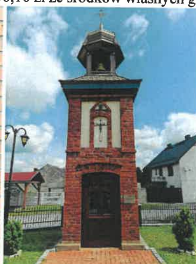
Kapliczka dzwonnica w Dańcu.