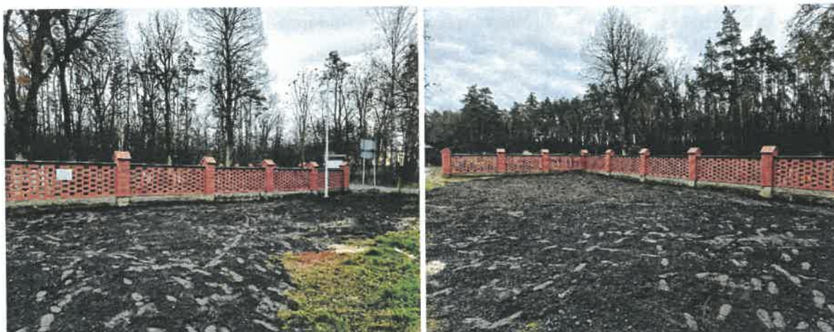
Ogrodzenie cmentarne w Suchym Borze.

W/w prace zostały wykonane od strony północnej (parkingu) i strony zachodniej (frontu cmentarza).